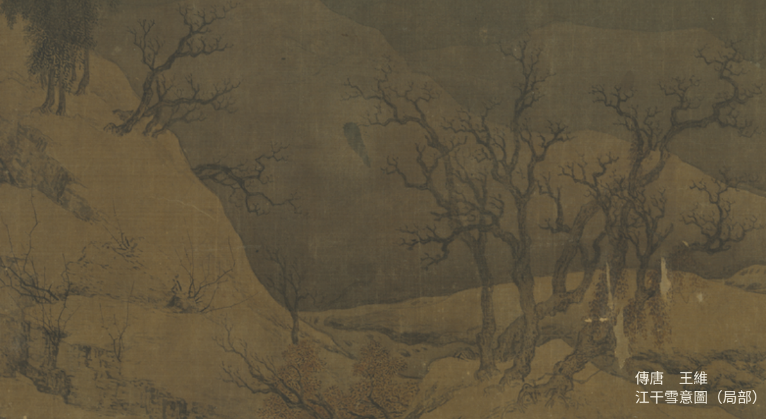
傳唐 王維 江干雪意圖（局部）