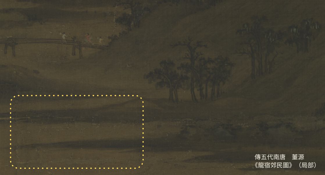
傳五代南唐 董源 《龍宿郊民圖》（局部）