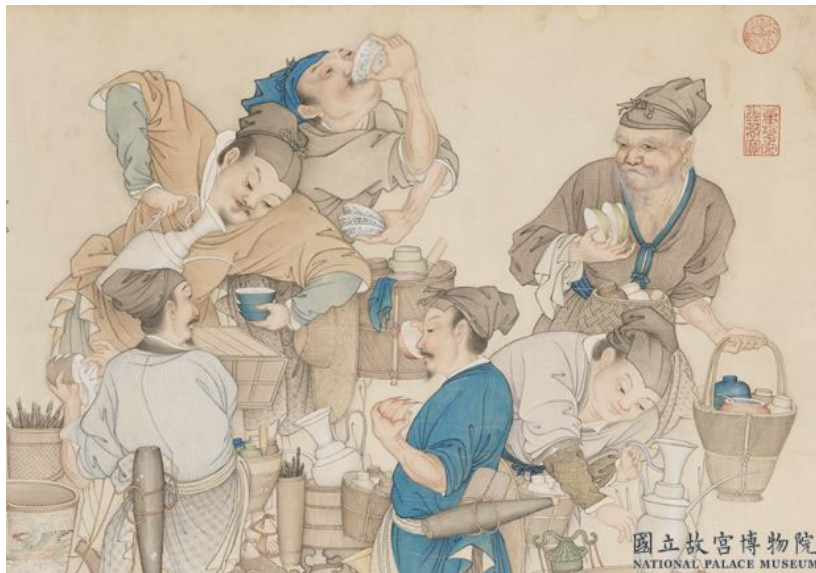
清姚文瀚畫賣漿圖